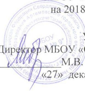
График прохождения курсов повышения квалификации до 2020 года